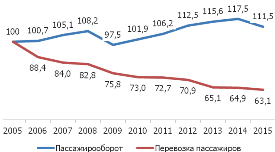
Рост (снижение) пассажирооборота транспорта общего пользования в 2015 году, % к 2014 году